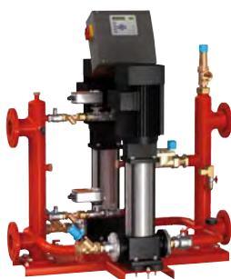
reflex 'gigamat' модульная конструкция мощность системы \leq 15 MW температура системы \leq 120 ^{\circ}\text{C}