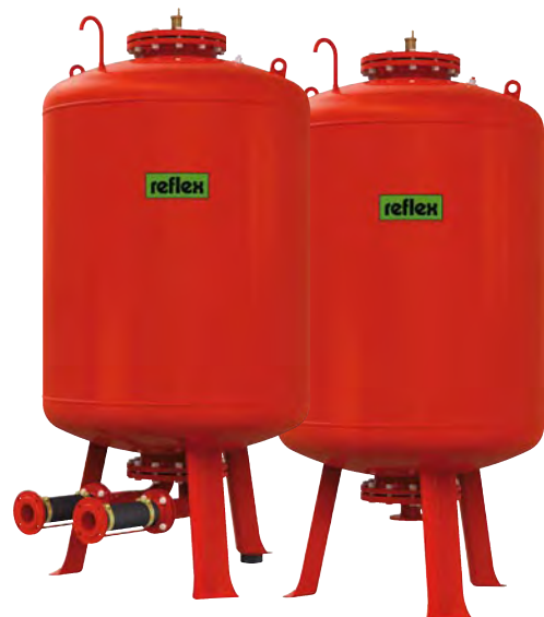
основная емкость GG